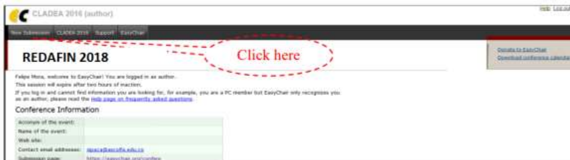
Figura 7. Página principal para autores.

Nota: Si el nombre de usuario que ha elegido ya ha sido asignado, es posible que usted se haya inscrito antes a EasyChair para otra conferencia. De ser así, solo tiene que pedirle al sistema que le recuerde su contraseña para ese nombre de usuario.