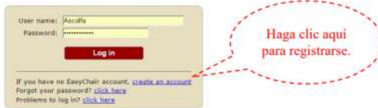
Figura 1. La página de acceso de “EasyChair” para Conferencia 2017.

Será dirigido automáticamente a una nueva página (Figura 2). Llene el cuadro de texto con las palabras o números de la imagen que aparecen justo encima y haga clic en “Continue”.