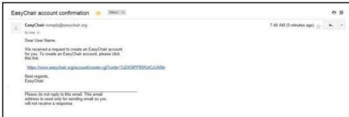
Figura 4. Mensaje de registro.

Después de registrarse, recibirá un mensaje en su correo electrónico como el de la Figura 4. Use el enlace que encontrará en el mensaje para continuar con el proceso de creación de cuenta.